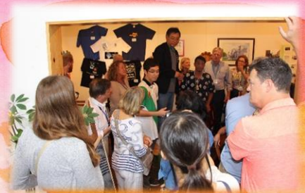
ギャラリーBunを訪問 姉妹都市の絆を再認識！