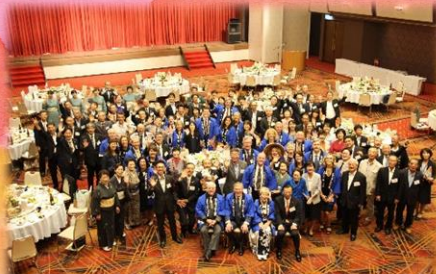
たくさんの方々にお越し頂き 歓迎交流会が催されました