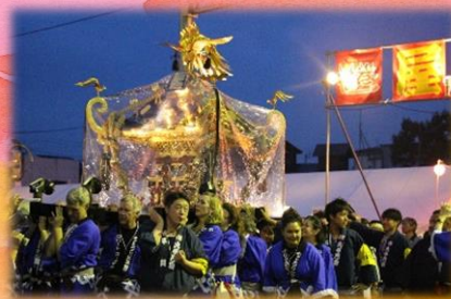
前日の歓迎交流会でプレゼント された半纏を着て参加★