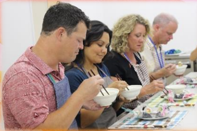
手作りの雑穀料理を体験 おなかいっぱいです！

先月4日から9日にかけて、アメリカ合衆国ホットスプリングス市より市民訪問団26名をお迎えしました。滞在期間中は、花巻市内を中心に学校訪問や施設訪問、花巻まつりへの参加をされました。訪問時の様子を一部ご紹介させていただきます。