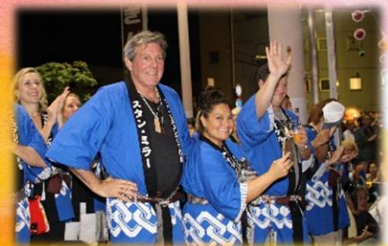
郷土芸能や山車を間近で見学 屋台の料理もおいしく堪能されたご様子