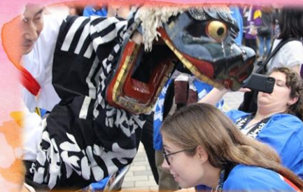
権現舞を見るのも初めて！ 表情が少し不安げです