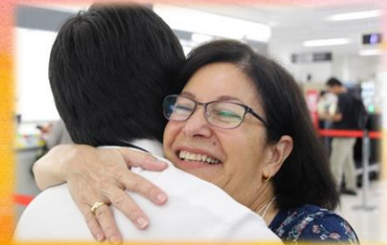
最後は笑顔で^^ 10月は ホットスプリングス市で会いましょう！

10月4日から10日にかけては花巻市側からホットスプリングス市へ市民ツアーが実施されます。また、9月に受入れを行ったオーストラリア共和国ギムナジウム生の受入の様子は、来月号にて紹介致します。