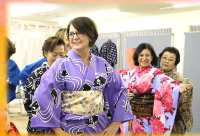
振袖や着物の着付け体験 笑顔で楽しんでました♪