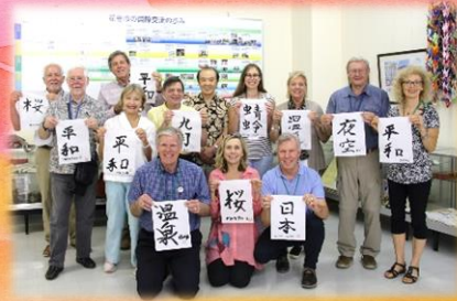
習字作品を持って記念撮影 いろいろな字を書きました